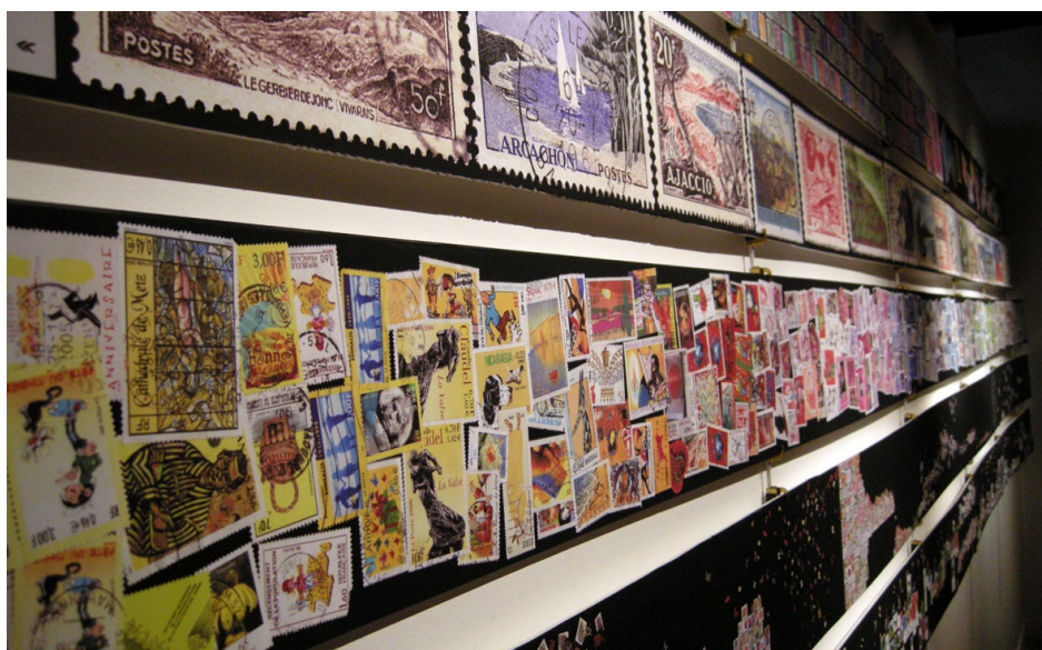
"La Poste, vue par l'école Duperré", jusqu'au 29 août.

Des fresques de timbres dont les illustrations se détachent de leur cadre dentelé et reprennent leur liberté. Des enveloppes qui, superposées, se muent en façade d'immeuble et dont les fenêtres d'adresse deviennent alors des balcons ou des baies vitrées laissant apparaître des personnages. Des vidéos projetées sur des colis. Des cartes postales qui transitent au plafond... Toutes ces œuvres plus originales les unes que les autres ont été réalisées par une vingtaine d'élèves de l'école Duperré (Ecole supérieure des arts appliqués de Paris). Elles sont présentées dans la salle 12 du Musée, un espace désormais consacré à des expositions menées en partenariat avec des écoles d'art et à des présentations de mail art.