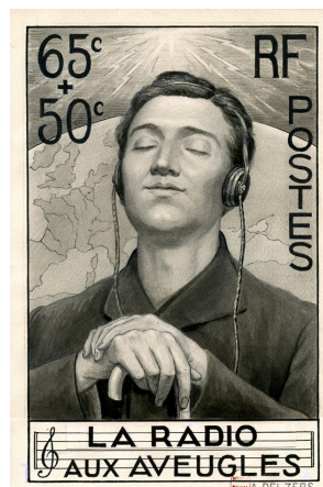
Maquette du timbre-poste Louis Braille, dessinée par Serres (1948)